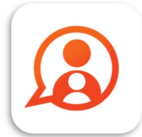
Konnnect OuderApp Konnnect B.V.